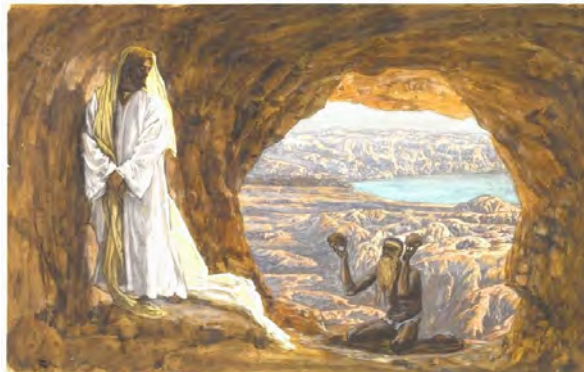
Jesus Tempted in the Wilderness James Tissot, Brooklyn Museum

large extent this preparation time determines how successful and joyful the expected event will be. We also prepare for the important events of the Church and our congregation for various periods of time, depending on the scale of the feasts. For example, we prepare for Christmas during the four weeks of Advent. We usually prepare for significant anniversaries of the congregation a year in advance. As Easter is the most important and serious event of the Christian faith, we prepare for it for forty days. The very name of the Time of Lent indicates the seriousness of this time. The Gospel of Mark describes a case ( Mark 2: 18-20 ) in which the disciples of John the Baptist and the Pharisees encounter Jesus and his disciples. The question occurs: why are Jesus' disciples, unlike John's disciples, not fasting? Jesus